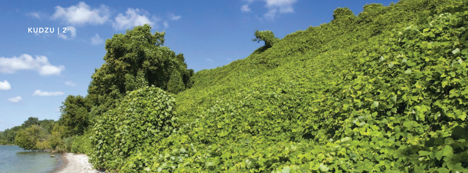
Invasion de kudzu près de Leamington (Ontario), sur les berges du lac Érié.