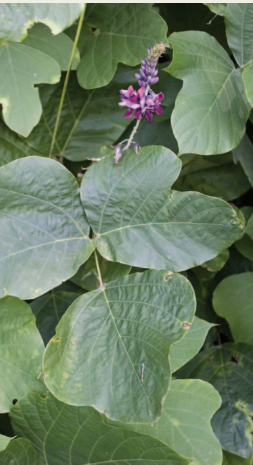
Feuilles et fleurs de kudzu.

Le kudzu est une vigne grimpante vivace originaire de l'Asie de l'Est qu'on a trouvé récemment à Leamington, en Ontario. La plante a été introduite en Amérique du Nord en 1876 pour aménager un jardin de l'Exposition centennale de 1876 tenue à Philadelphie, en Pennsylvanie (États-Unis). On a par la suite encouragé son utilisation comme fourrage à bétail, pour empêcher l'érosion et comme plante ornementale, et conséquemment, on l'a planté en de nombreux endroits dans le sud-est des États-Unis.