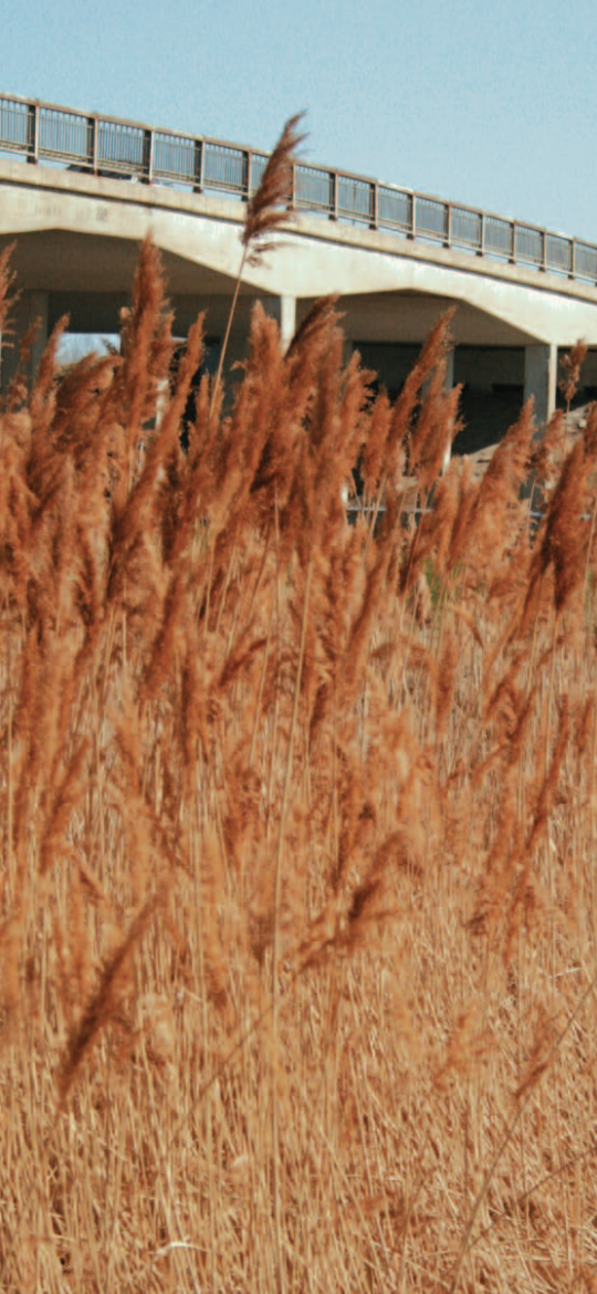
Phragmite envahissant poussant sur le bord d'une route.