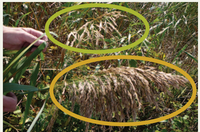
Photo du peuplement envahissant fournie gracieusement par Janice Gilbert, MRN.

Une tige porte-graines d'un phragmite indigène (en haut) et une tige porte-graines d'un phragmite envahissant (en bas). Remarquez que la tige porte-graines de l'espèce indigène est plus petite et moins dense que celle de l'espèce envahissante.