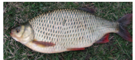
Le rotengle est un méné à corps épais.