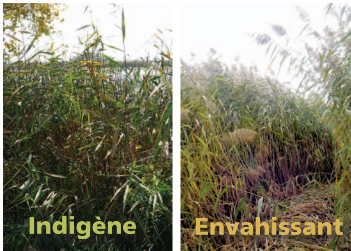
Figure 1 : Un peuplement de phragmites indigènes (à gauche) et un peuplement de phragmites envahissants (à droite). Remarquez la végétation variée et la densité plus faible des tiges des phragmites indigènes dans le peuplement de gauche, tandis que les tiges des phragmites envahissants, à droite, sont plus hautes et plus denses.

Le phragmite envahissant se reproduit par dispersion de ses graines, par les rhizomes de ses racines ou par des fragments de stolons. La dispersion peut se faire naturellement par l'eau courante, l'air ou les animaux qui se déplacent, ou résulter des activités humaines comme l'horticulture et le déplacement des embarcations, des remorques ou des véhicules tout-terrains. Les rhizomes du phragmite envahissant peuvent croître horizontalement de plusieurs mètres par année. Il s'agit de sa méthode de reproduction la plus courante. La tige peut croître de 4 cm par jour et produire des milliers de graines par année.