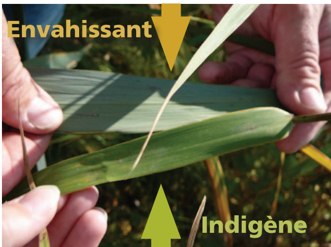
Figure 3 : Une feuille de phragmite indigène (bas) et celle d'un phragmite envahissant (haut). Remarquez la couleur jaune vert de la feuille du phragmite indigène, tandis que celle du phragmite envahissant est bleu vert.