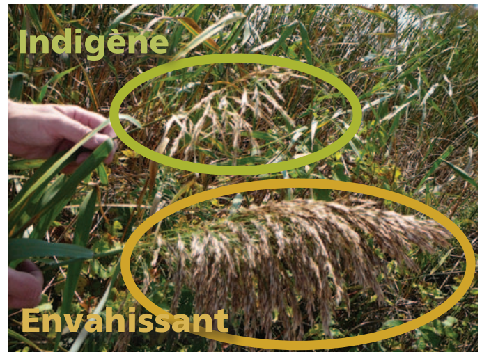
Figure 4 : Une tige porte-graines d'un phragmite indigène (haut) et d'un phragmite envahissant (bas). Remarquez que la tige porte-graines du phragmite indigène est plus petite et moins dense que celle de l'espèce envahissante.

Les tiges du phragmite envahissant sont généralement de couleur havane ou beige, ses feuilles sont bleu vert et ses tiges porte-graines grandes et denses, contrairement au phragmite indigène, dont les tiges sont brun rougeâtre, les feuilles jaune vert et les tiges porte-graines plus petites et plus clairsemées (figures 2, 3 et 4). On n'a confirmé aucun croisement sur le terrain entre des phragmites indigènes et envahissants, mais on a réussi à en produire en laboratoire. Dans certaines conditions environnementales, telles celles qui prévalent le long des rives côtières sablonneuses et dans les systèmes où l'eau est profonde, les différences morphologiques décrites ci-dessus ne sont pas déterminantes. Si l'on n'arrive pas à savoir si on est en présence d'un plant de phragmite indigène ou envahissant, il est recommandé de consulter un expert en phragmites.