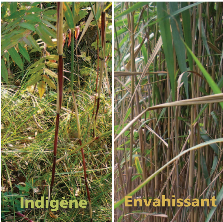
Figure 2 : Une tige de phragmite indigène (à gauche) et celle d'un phragmite envahissant (à droite). Remarquez la tige brun rougeâtre à gauche et celle havane ou beige de l'espèce envahissante à droite.